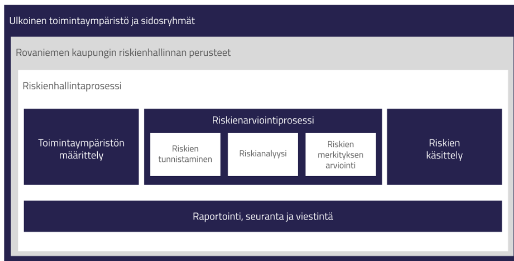
Kuva 2. Riskienhallintaprosessi

Riskienhallintaprosessiin kuuluvat toimintaympäristön analysointi, riskien riittävän kokonaisvaltainen tunnistaminen ja kuvaaminen, riskien toteutumisen arviointi (merkittävyys ja todennäköisyys) sekä erityisesti merkittävien riskien osalta niiden hallintakeinojen raportointi ja seuranta.