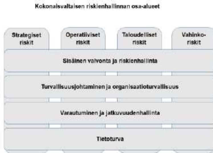
Kuva 1. Kokonaisvaltaisen riskienhallinnan osa-alueet